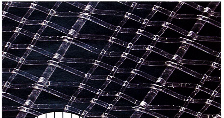
●「通るクン」の拡大写真